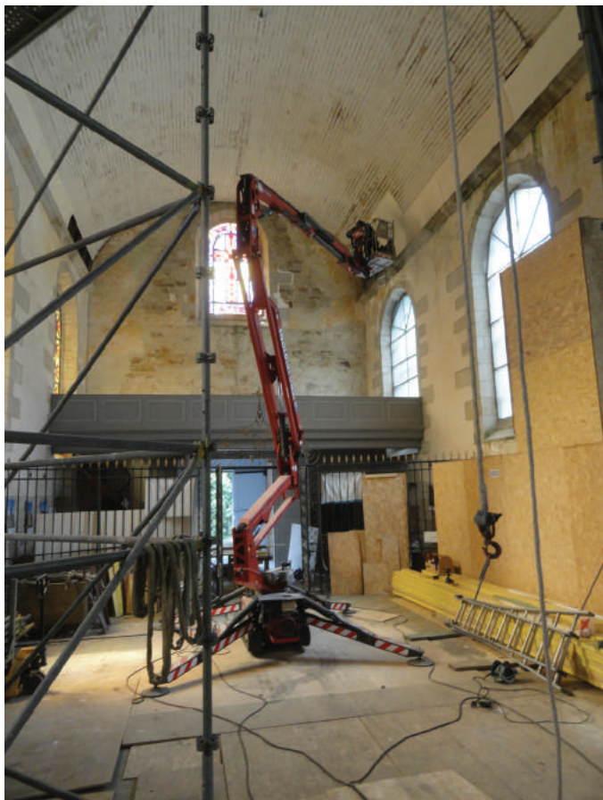
Travaux de la nacelle, en cours.

Cette sécurisation consistait à purger les zones d'enduits délaquées ou gravats présents sur les corniches qui menaçaient de tomber, puis à masquer les zones de lambris lacunaires ou dégradées pour prévenir les éventuelles chutes de gravats et poussières de l'extrados de la voûte. Ces travaux ont été effectués depuis une nacelle.