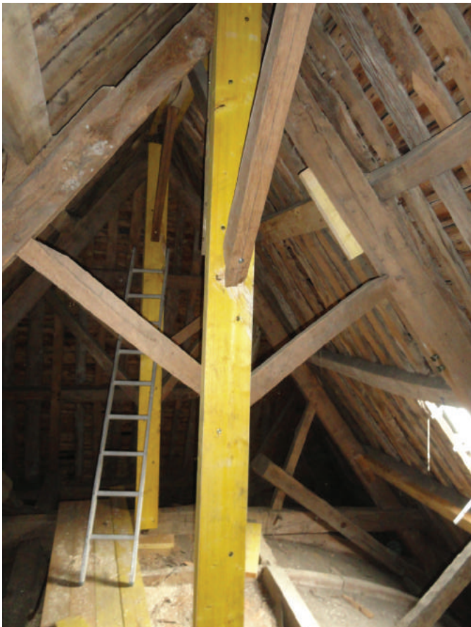
Moisement des poinçons fracturés.