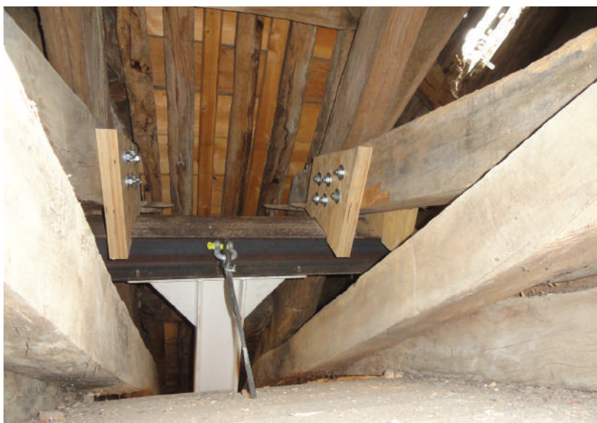
Boulonnage des goussets d'appuis aux entrails retroussés.