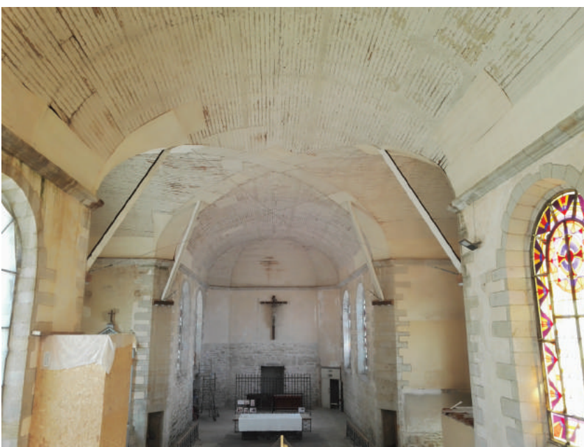
Vue d'ensemble de la croisée étagée.