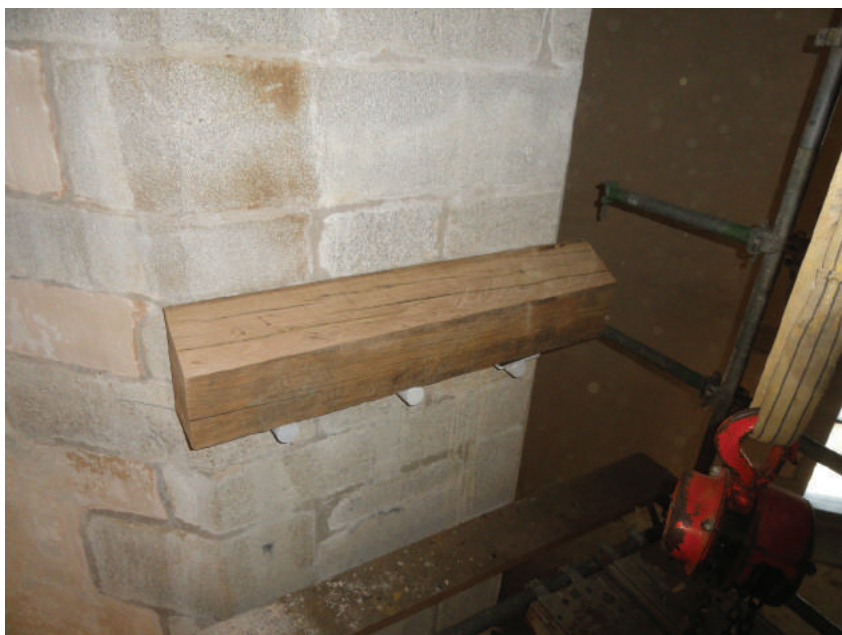
Mise en place du collecteur sur les 3 ferrures d'ancrage en diamètre 50mm.