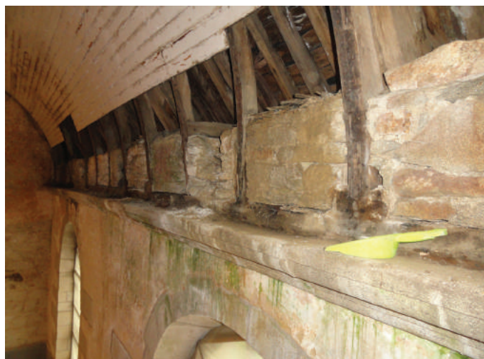
Nettoyage des gravats des corniches