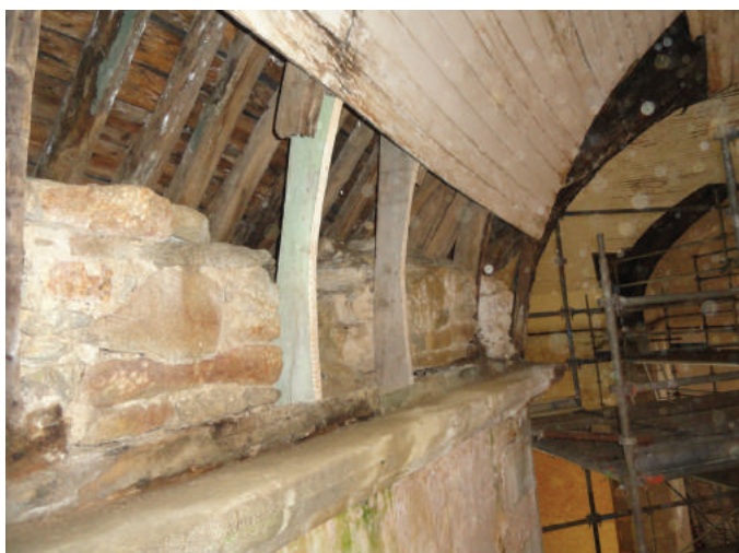
Complément des cerces provisoires, suivant le cas.