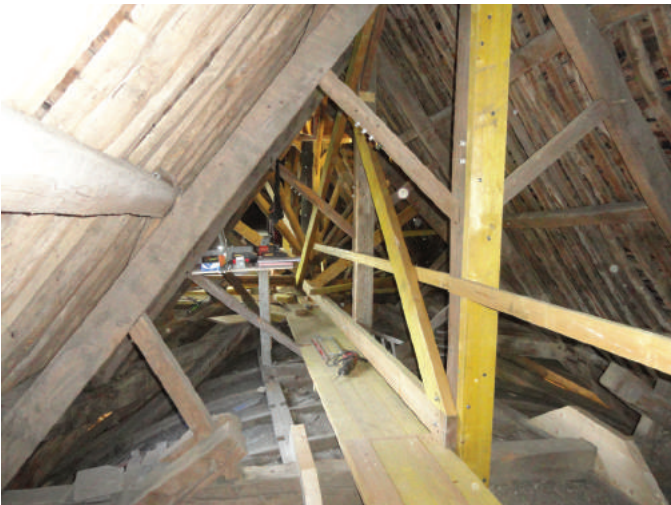
Aménagement du chemin de planche.