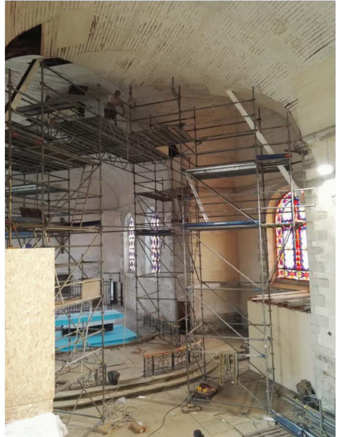
Étalement mis en charge et masquage des zones de lambris lacunaires.