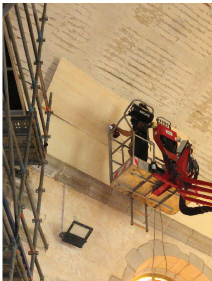
Vissage des panneaux de contre-plaqué.