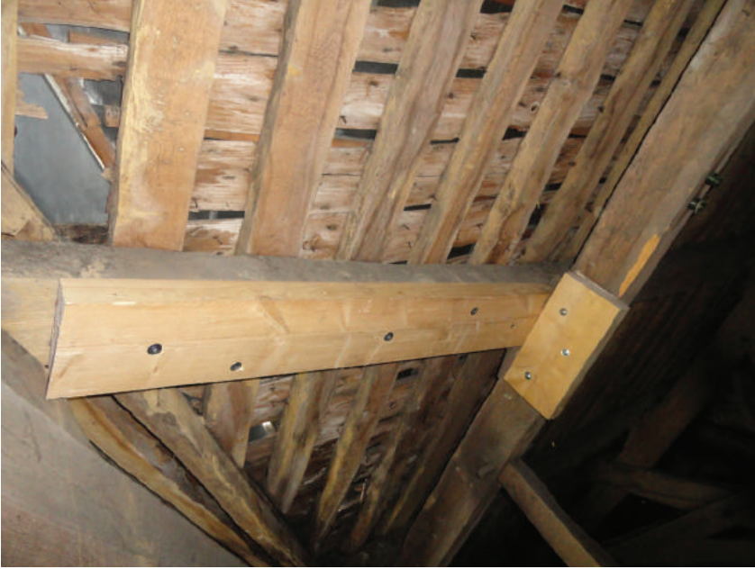
Doublage des pannes trop affaiblies.