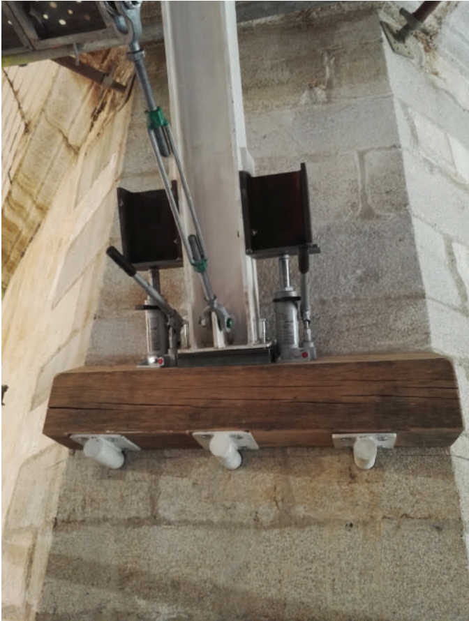
Mise en charge des poteaux et des tirants.