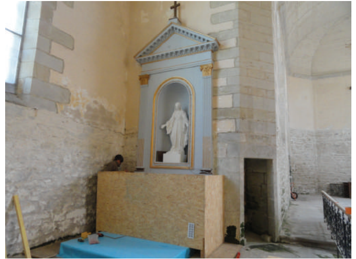
Encoffrement du retable Nord.