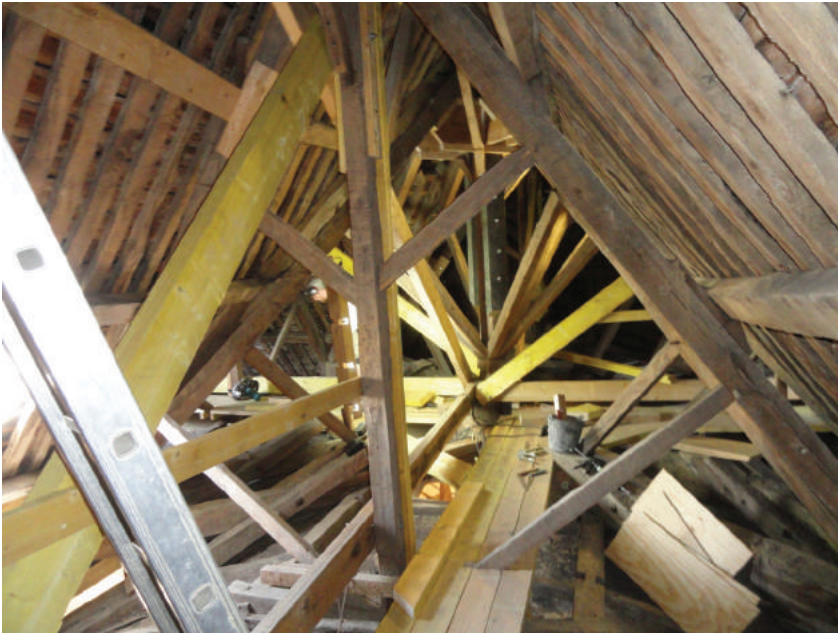
Renforcement des 4 travées de faitages attenantes à la croisée par ajout d'un sous-faitage et de grands liens de contreventement.

Ces renforcements consistaient à renforcer provisoirement les pièces fracturées par l'affaissement de la croisée. Un chemin de planches a également été aménagé pour permettre une circulation plus aisée dans les combles.