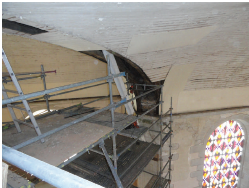
Approvisionnement et levage des poteaux métalliques d'étaie.