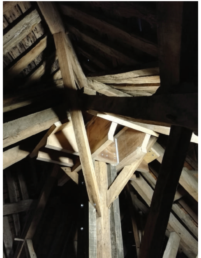
Renforcement de la "hune", assemblage des têtes d'arbalétriers et poinçon de la croisée.