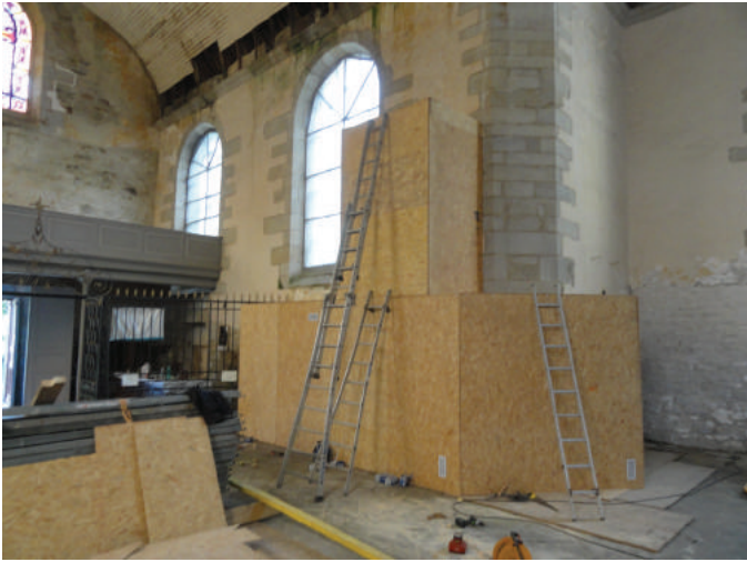
Protection du sol et encoffrement de la chaire à prêcher et du confessionnal.